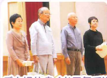
ご夫婦仲良くお元気で!!